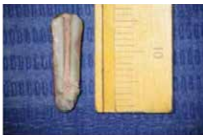
Figura 1. Muestra de microfiltración apical con técnica de obturación de condensación modificada