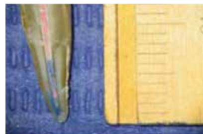
Figura 2. Muestra de microfiltración apical con técnica de obturación de cono único